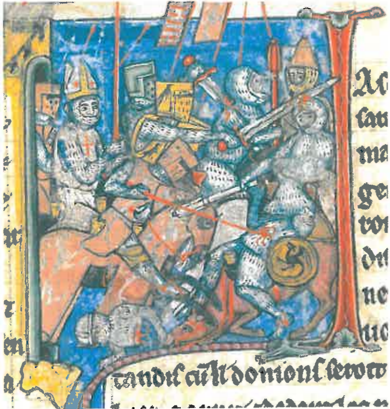
Adhémar de Monteil à Antioche.