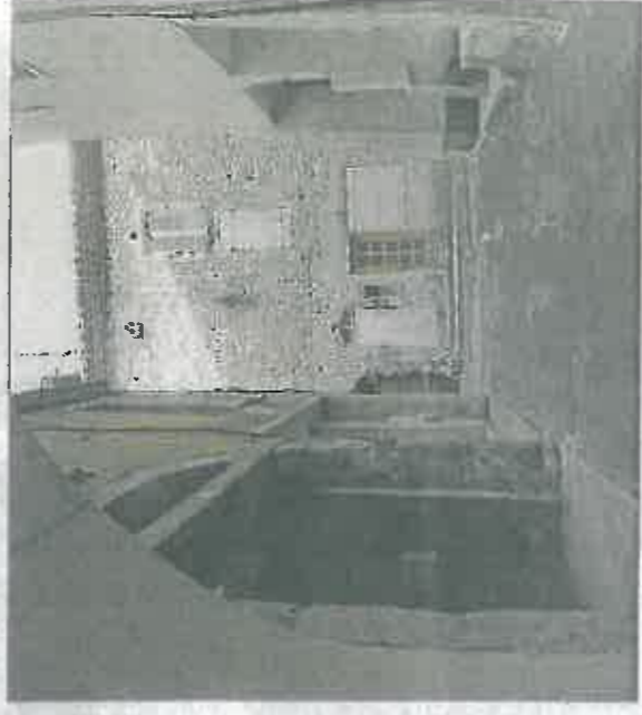
La rue Juiverie.

En marge du projet de rénovation de l'habitat, un programme sera mandaté par la commune en 2016 pour chiffrer la rénovation et l'ouverture au public de la Tour judeorum, la réinstallation de l'Arche Sainte hébraïque et des maisons alentours, dont le mikvé. Un cheminement piéton dénommé «musée à ciel ouvert» guidera les Tricastins et les visiteurs.