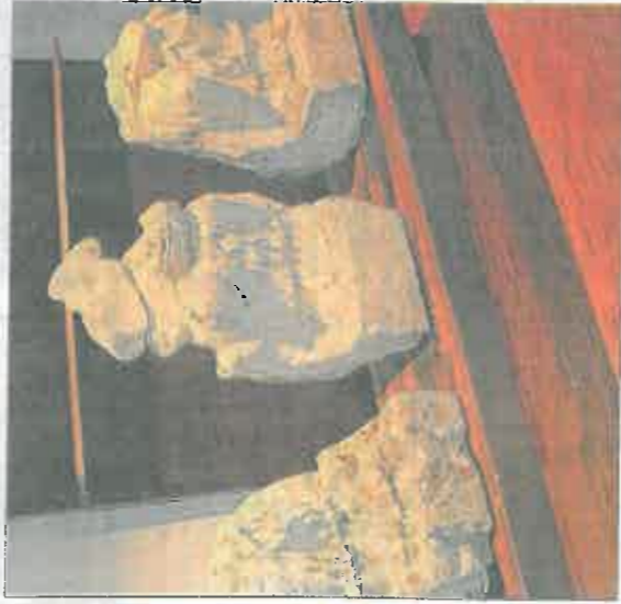
La triade des déesses mères d'Allan, figure parmi les pièces présentées.

L'Arche sainte hébraïque, datée du XV e siècle, est un monument unique en France et en Europe. Prêtée au Musée du Judaïsme à Paris, elle est à nouveau présentée au Musée d'archéologie tricastine pour l'exposition sur les rites. Découverte au cœur du quartier juif de la ville, elle témoigne de l'attachement de sa communauté à la religion. En effet, à partir du XIV e siècle, les juifs n'étant plus autorisés à construire de synagogue, les richesses se portent surtout sur le mobilier liturgique, d'où le faste de cette Arche destinée à recevoir les rouleaux de la Torah.