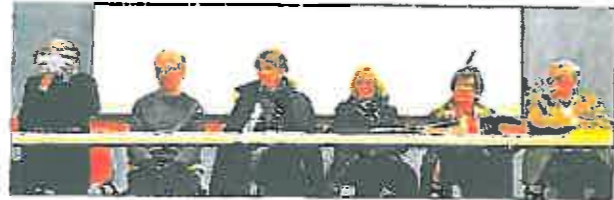
Le projet de rénovation du parvis de la cathédrale a suscité des réactions dans l'assemblée.

Les projets ne manquent pas La Société d'Archéologie et