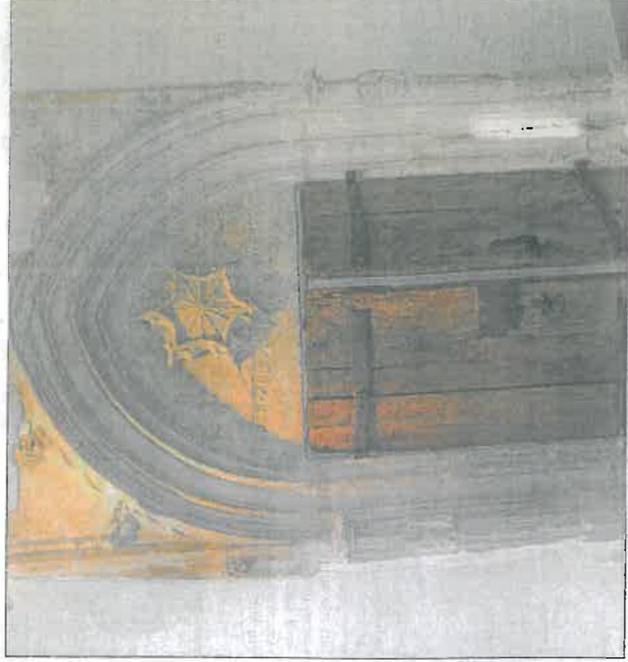
L'arche sainte se trouvait au cœur du quartier juif médiéval.

Situé place Castellane, il est ouvert du mardi au samedi de 14h30 à 18h et le 1 er dimanche du mois. Tel 04 75 04 74 19, www.musat.fr. Le musée accueille actuellement l'exposition «Rites gaulois et romains entre Rhône et Alpes».