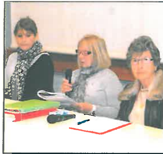
Les projets et le travail se font pas pour eux bénévoles de l'association qui ont reçu le soutien de l'adjointe de la culture.